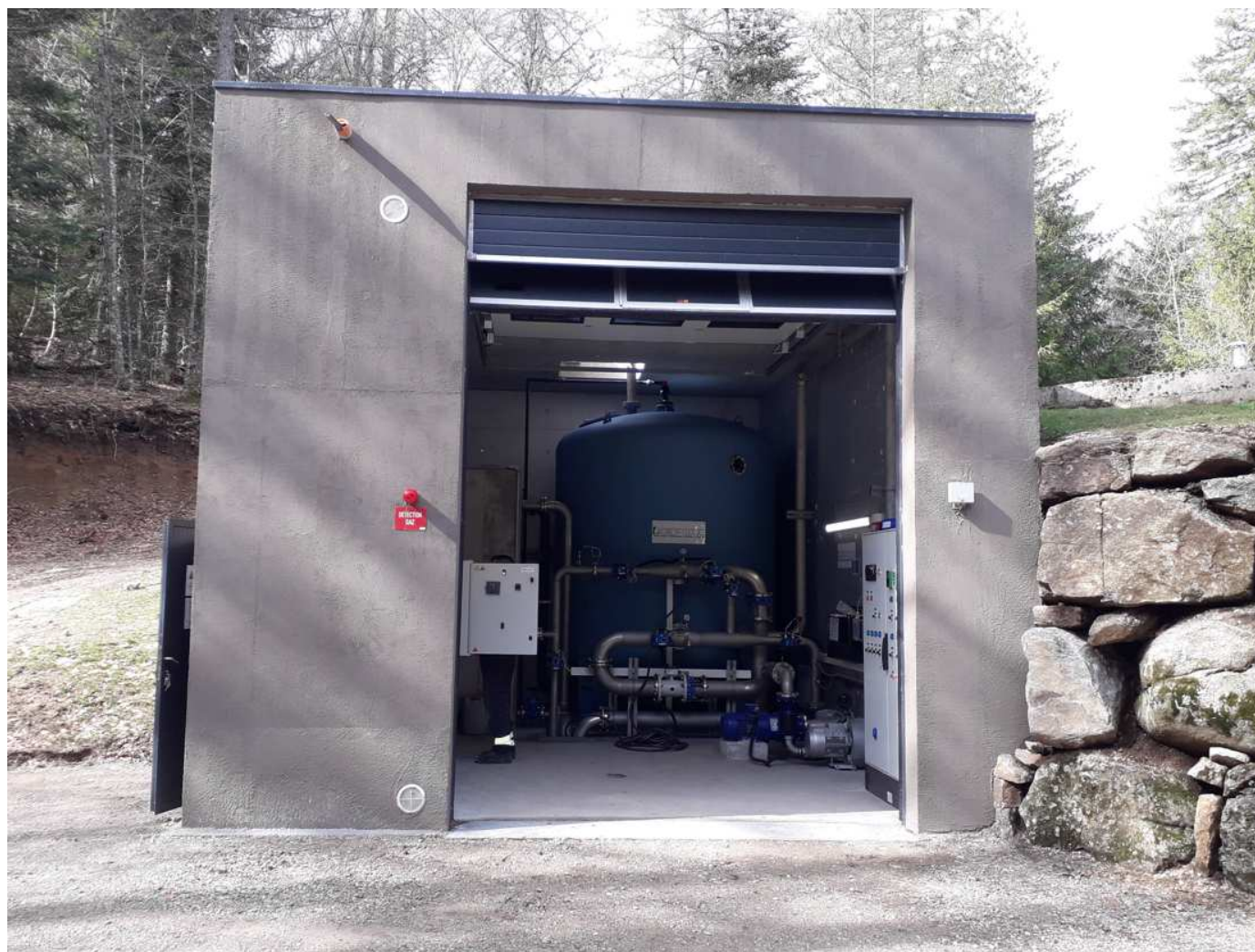
Exemple d'installation existante – Saint Sauveur Camprieu